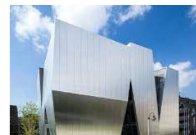
⑦ すみだ北斎美術館